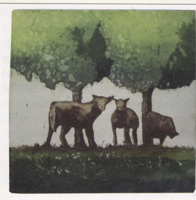
'Lente', een ets/aquatint (13 x 13 cm) uit 2006.

Nicole werkt vooral in de houtsnede- en estechniek. Bij de houtsnedes vallen met name de bloemmotieven op: rozen, zonnebloemen en tulpen. Na het uitsnijden van de vorm brengt ze met een roller de inkt aan, vaak in verschillende kleuren. Daarna drukt ze in één drukgang de prent.